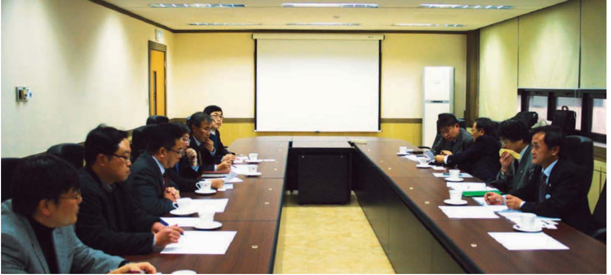
2012년 ICOLD 연차회의 Pre-tour 코스 답사 일본대담회 방문 (2010. 11. 23~26)