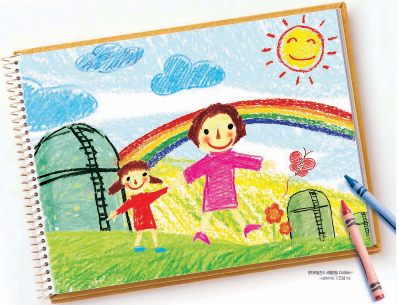
원자력발전소 체험관을 다녀와서 - 서양초등학교 4학년 김민서

“아빠! 원자력이 탄산가스를 배출하지 않고 지구온난화를 방지하는 친환경 에너지래요!”